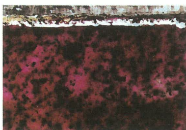
サビクリーン塗布