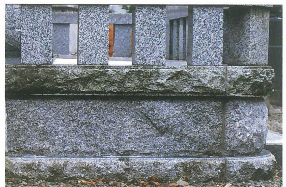
「エフロクラッシュ」洗浄後