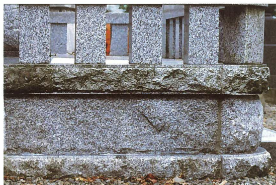
「エフロクラッシュ」洗浄後